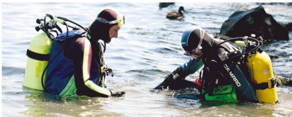
DER LETZTE SICHERHEITSCHECK vor dem ersten, tiefen Ausatmen ist auch beim Tauchen im Zürichsee nötig.

Sofort stellen sich die Gefühle ein, die ich am Tauchen mag: Die absolute Stille, die Schwerelosig-